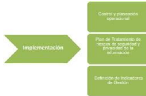
Figura 4 - Fase de implementación 2

Esta fase le permitirá a la Entidad, llevar a cabo la implementación de la planificación realizada en la fase anterior del MSPI